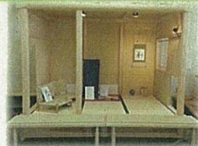
正面玄関に設置した組立茶室